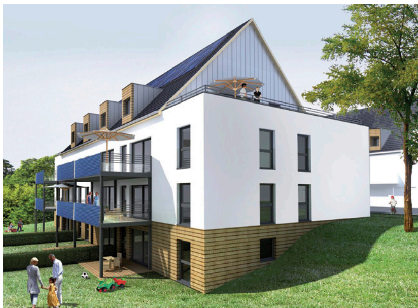
Les Rives de la Coulée Verte à Belfort : bâtiment passif.