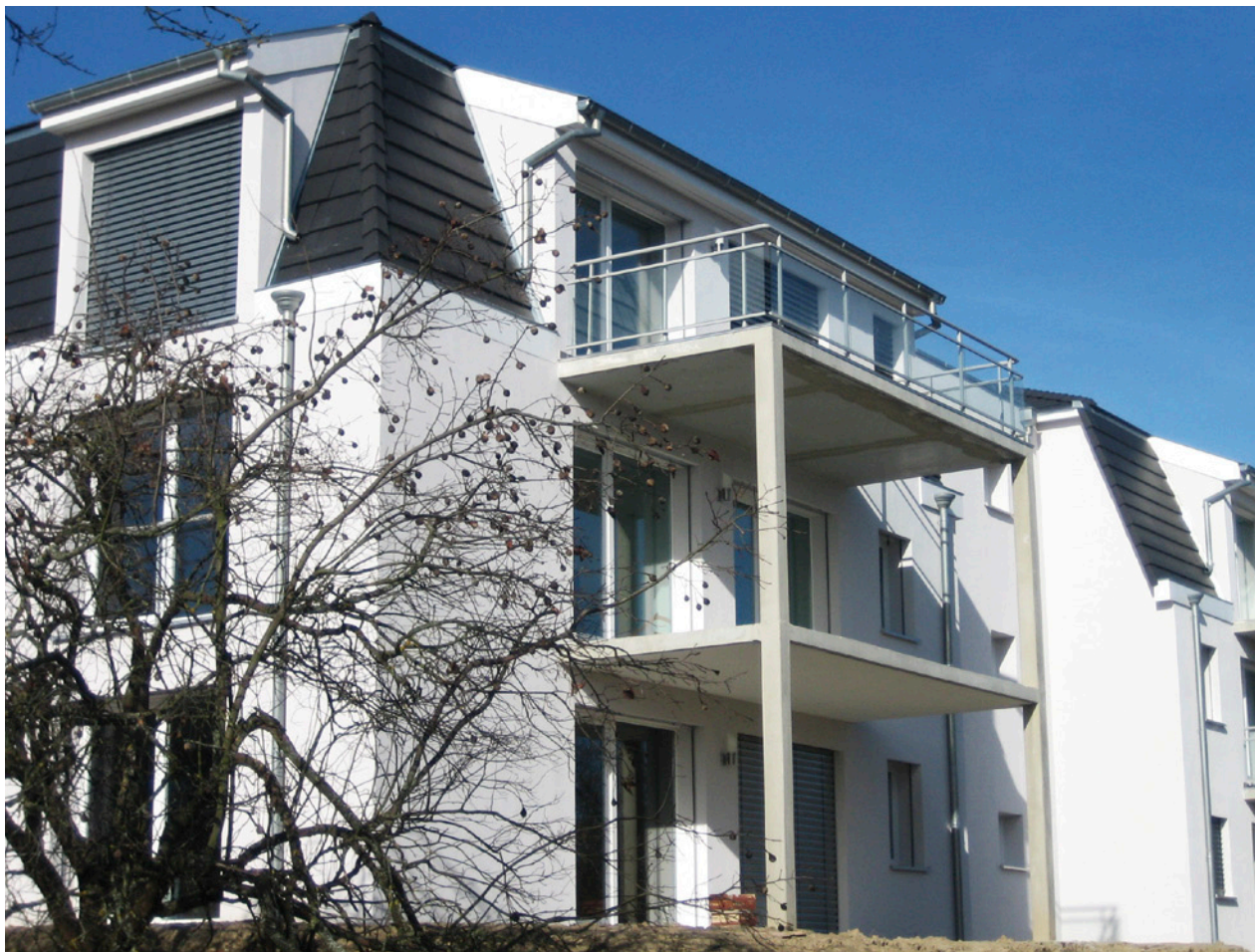
La résidence « Le parc du Muehlmatten », lauréat de l'appel à projets 2008 « Bâtiment économe en énergie » réalisé par la région Alsace et l'ADEME accueille ses premiers usagers ce mois-ci.